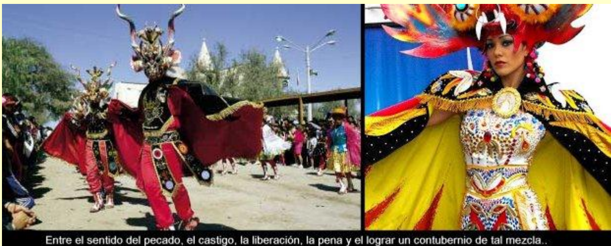
Entre el sentido del pecado, el castigo, la liberación, la pena y el lograr un contubernio de tal mezcla..

En el presente caso, la herencia de lo acontecido mucho antes y el proceso forzado de condicionamiento después, quedó enmarcado con su forma destructiva en la dispar comunidad boliviana y conforma hasta hoy formas de pensar prestadas en la reducida clase dominante económico-política de Bolivia, así como en las formas de comportamiento en constante contradicción de la gente común y sus nuevas tradiciones muy poco auténticas.