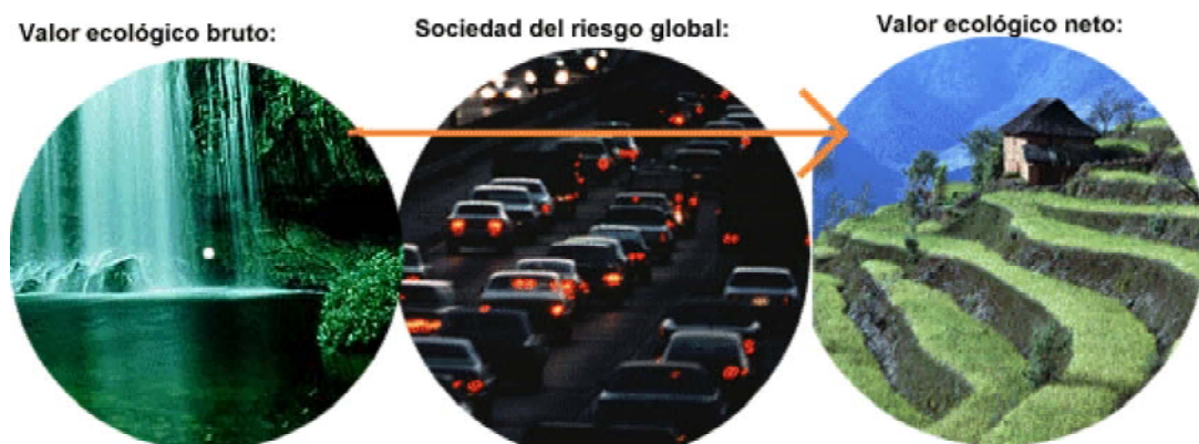
Fig. Todo intento por lograr un desarrollo integral humano sostenible, depende de la evaluación correcta de nuestra condición ecológica inicial, (bruta) en comparación a todas las alteraciones producidas por la "sociedad del riesgo global". Así desde allí, se puede proyectar una sociedad en busca de un valor ecológico neto que depende de la información integral sobre nuestro entorno

Del mismo modo, bajo la perspectiva cognitiva, cuando el ser humano hace consciencia de todos los riesgos y efectos secundarios de su conducta artificial, y es capaz de neutralizar o desarmar estos efectos casi por completo, este ser humano ha logrado, una especie de valor ecológico neto . Allí el entorno natural gracias al actuar conscientemente ecológico, vuelve a ser la fuente renovada de las condiciones y perspectivas de existencia biodiversa y homeostática que permite una distribución equitativa y sostenible de los recursos.