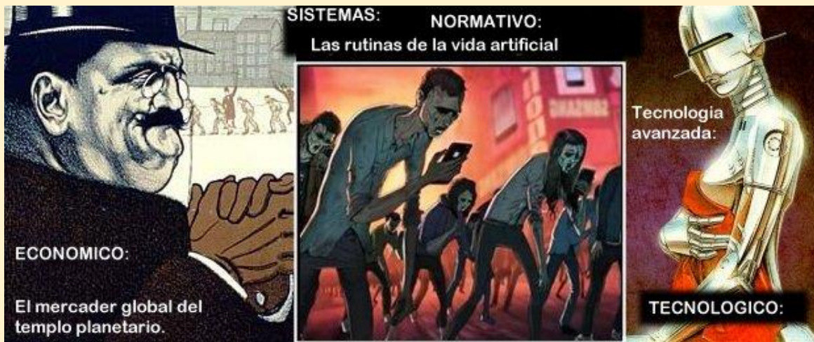
Fig. ¿Podrían, los sistemas artificiales de información, haber tenido otro curso de "evolución"? - Si, si estos habrían actuado en paralelo con la evolución natural en trascendencia universal, conforme a la entropía negativa que motiva tal evolución.

--- Nota. El trabajo humano es el de siempre, mientras exista en acción los motivadores de tal vivencia sana en: inteligencia información y formas de utilizar recursos equilibrados para la vida.