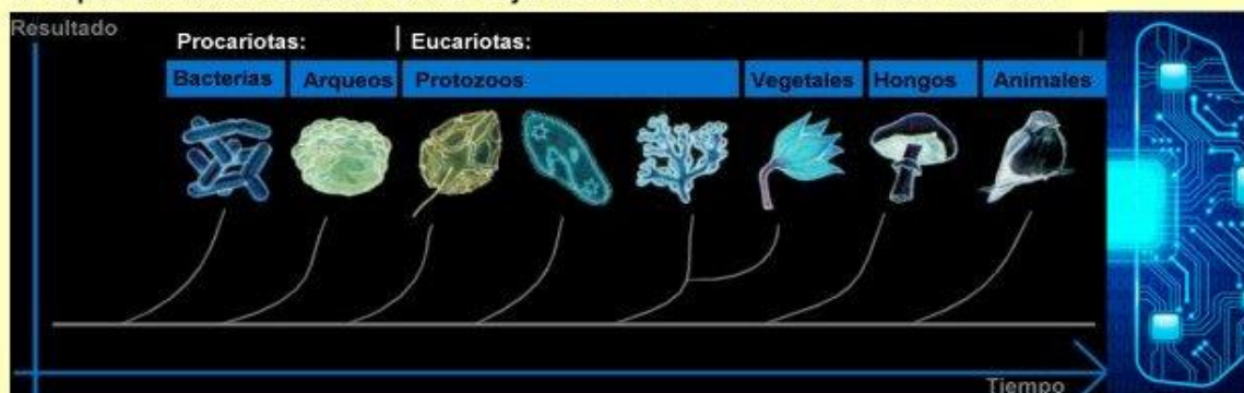
Fig. Curso normal de la evolución, hasta que fue sometida a la artificialización más destructiva que contributiva a la naturaleza del ser vital.

El "lenguaje" de la evolución de la vida, no es el mismo que el del desarrollo de los artificios y su posible inteligencia. La inteligencia natural deviene del entorno natural, la inteligencia artificial es un capricho creativo humano. Tal vez mejor definirlo como un error evolutivo humano.